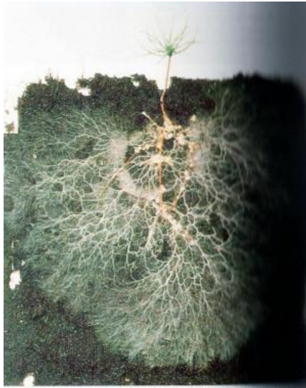
Ectomicorrizas em plântula de Pinus com 4 cm acima do solo (extraído de Raven et al. 2001)

Vemos la maraña blanca de los filamentos de micelio que parten de las micorrizas de la raíz del árbol: esto es el hongo y lo que produce las setas que nosotros recogemos en el bosque.